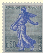
Fig. 5a-5b Due dei tanti francobolli francesi emessi con l’effigie della