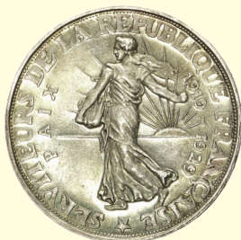
Fig. 4 Medaglia per il decennale dalla fine della Prima guerra mondiale con la Semeatrice e i ritratti di Clemenceau, Poincaré e Briand