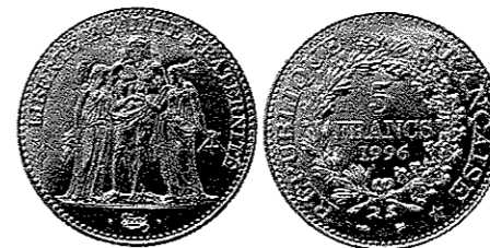
5 francs Hercule de 1996.

sur la pièce en cupro-nickel de 1996. Seules les émissions de 2011 présentent une tranche lisse. Or une tranche travaillée est un élément de plus qui rend plus difficile la contrefaçon.