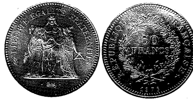
Pièce de 50 francs Hercule émise entre 1974 et 1980.

Le thème, repris par cette nouvelle émission de la Monnaie de Paris, est un thème classique de la numismatique républicaine française. Il est dû à Augustin Dupré (1748-1833), graveur général des Monnaies de 1791 à 1803. Il a été nommé suite à la réforme monétaire de la Convention et l'adoption de sa proposition de Louis conventionnel. Il sera révoqué par Napoléon I er . Son différent monétaire en sa qualité de graveur général était un coq.