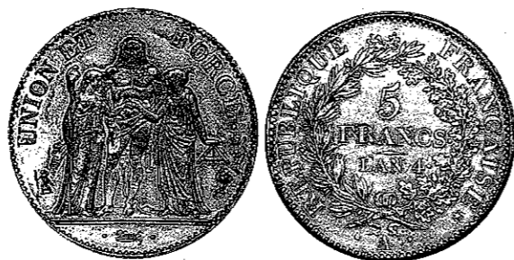
5 francs • Union et Force • émise pendant le Directoire et le Consulat. © Vinchon.

Le graphisme de l'avvers de ces pièces (Hercule de face) avait été présenté à la presse spécialisée par Christophe Beau, PDG de la Monnaie de Paris, lors du « Münzen-Forum » du salon international de Berlin, en janvier 2011. Le lancement de la souscription de la pièce a été annoncé le 1 er avril 2011 pour une mise en place à la Poste et à la Monnaie de Paris du 8 avril au 7 mai. Les pièces seront délivrées aux souscripteurs et professionnels entre le 14 juin et le 30 juillet 2011. Il est prévu une émission de 50 000 pièces pour la 100 € argent et une émission de 10 000 pièces pour la 1 000 € or.