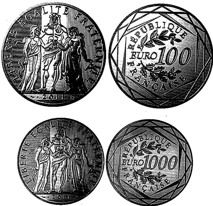
La 100 € argent et 1 000 € or Hercule 2011.

À noter que toutes ces émissions avaient une tranche avec une légende inscrite en creux ou en relief. Au pire, la tranche était cannelée comme