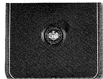
Vue intérieure du coffret BE 2005.

Le coffret rouge à l'intérieur a lui aussi le blason des Grimaldi et les armoiries des princes, il contient une pièce de 1 c d'euro en qualité BE au millésime 2005. Il y en a trois cents exemplaires.