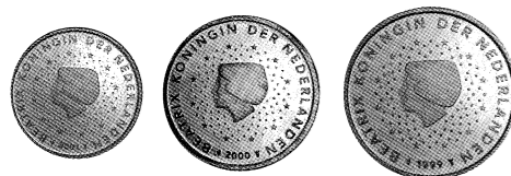
Avers des pièces de 1, 2 et 5 cents des Pays-Bas.

Aux Pays-Bas, un accord entre le syndicat de la grande distribution et les organisations de consommateurs en matière d'arrondissement des prix a entraîné un très net ralentissement de l'utilisation de ces coupures. Cependant, l'État néerlandais continue de frapper ces coupures pour la circulation. Il n'y a pas eu de décision politique sur ce sujet.