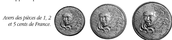
Avers des pièces de 1, 2 et 5 cents de France.

A l'inverse, d'autres pays estiment que ces coupures ne doivent pas être supprimées. C'est le cas de la France notamment. Le Directeur de la Monnaie de Paris s'était ainsi prononcé pour le maintien de la production de ces coupures pour la circulation. Certes M. Beaux est partie prenante dans la production de coupures de circulation qui constituent par ailleurs une part importante de la production annuelle de la Monnaie de Paris. En outre, le gouvernement français a pris la décision de maintenir des volumes de frappe importants.