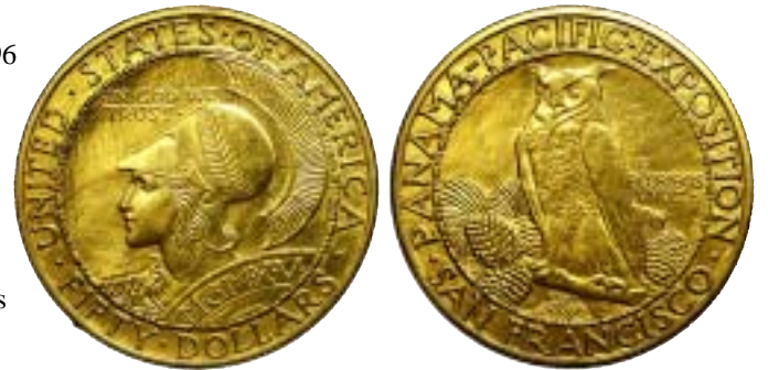
« Adjudée 26.100€, ordre maximum 32.930 € »

PS : les pièces invendues sont disponibles au prix de départ jusqu'à fin août 2005.