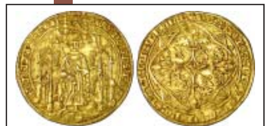
MONNAIES XX, n° 766 Pavillon d'or du Prince Noir, 4800 €