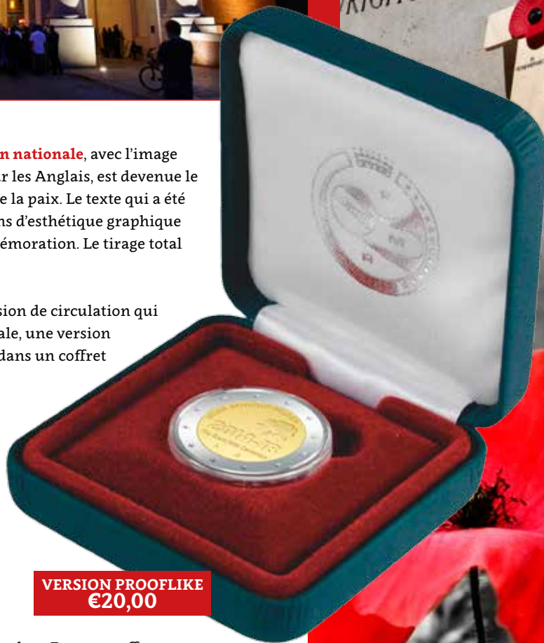
VERSION PROOFLIKE €20,00

THE GREAT WAR - DE GROOTE OORLOG - LA GRANDE GUERRE et par les dates 14 - 18.