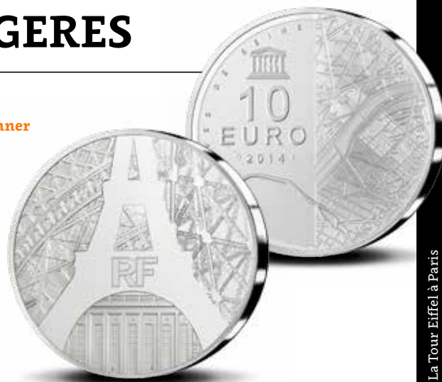
La Tour Eiffel à Paris