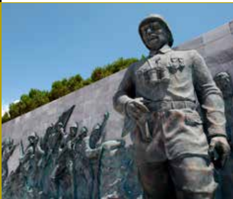
Le monument commémoratif des martyrs de Canakkale