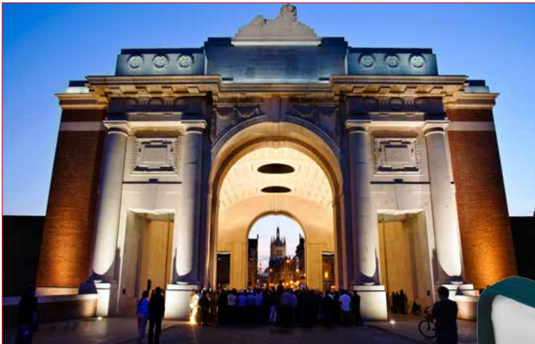
Photo: la Porte de Menin à Ypres