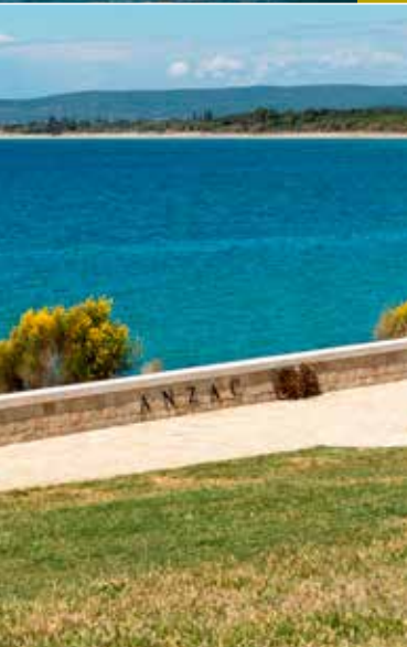
Monument commémoratif de la baie Anzac, Canakkale Turquie