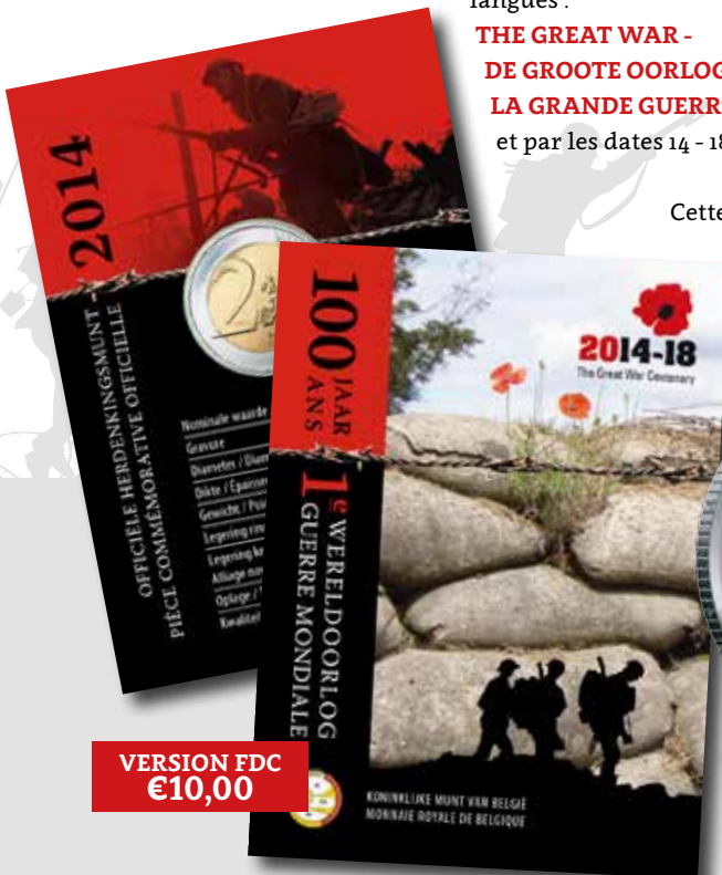
VERSION FDC €10,00

Cette pièce de 10 Euros est offerte d'une part dans un écrin standard et d'autre part dans un coffret de luxe en bois .