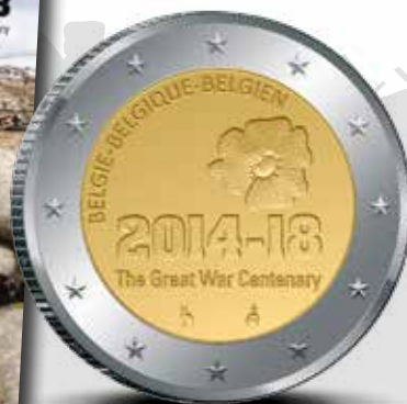
CARACTERISTIQUES 2 EUROS Version FDC Tirage 6.000 Version Prooflike Tirage 6.000