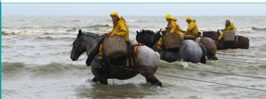
Photo: Pêcheurs à cheval à Oostduinkerke

Cela rend les pêcheurs de crevettes à cheval célèbres dans le monde entier ; un fait qui a été reconnu par l'UNESCO car, le 4 décembre 2013, les Pêcheurs à Cheval ont été repris dans la liste des chefs-d'œuvre du Patrimoine Culturel Immatériel de l'Humanité. Quand «l'Ordre du Pêcheur à Cheval», la société qui s'engage à la préservation de ce métier, a demandé à la Monnaie Royale d'y consacrer une émission de monnaie, nous n'avons eu aucune hésitation à accéder à cette requête.