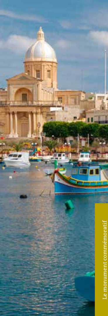
Les bateaux devant l'église St-Joseph, Vittoriosa, Malte