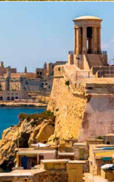
Siege Bell World War II Memorial à Valletta, Malte