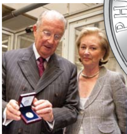
Le Roi Albert II et la Reine Paola lors de leur dernière visite à la Monnaie Royale en 2009.

L'abdication volontaire d'un roi est une première dans l'histoire de Belgique. En effet, la tradition est de voir l'héritier monter sur le trône à la mort du roi. Seul le Roi Léopold III abdiqua au début des années cinquante, mais cela en raison de son attitude durant la Deuxième Guerre Mondiale, attitude qui lui fut reprochée par certains. Bien que l'opinion publique était majoritairement favorable à son retour, Léopold III décida de céder sa place à son fils Baudouin.