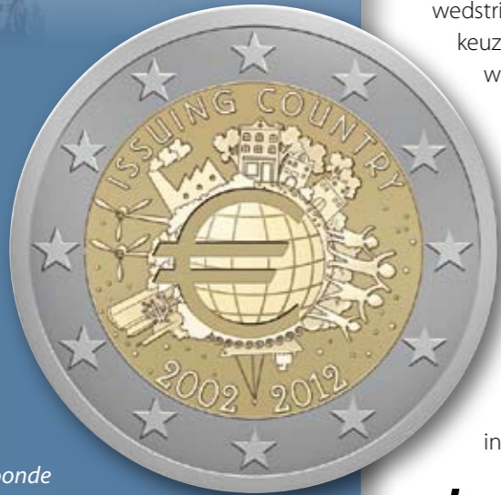
Het bekroonde ontwerp van de 2 Euro gedenkmunt 2012

En net zoals bij de twee vorige gelegenheden schreef ze hiervoor een ontwerp-wedstrijd uit. Na een eerste beoordeling kon het grote publiek vervolgens zelf een keuze maken uit een vijftal ontwerpen. Hieronder tonen we u deze ontwerpen waaronder het bekroonde ontwerp dat zal prijken op de speciale munt van 2 Euro die door 17 landen zal worden uitgegeven.