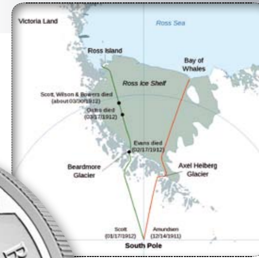
De routes die door Amundsen en Scott werden gevolgd om de Zuidpool te bereiken.