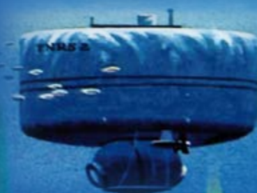
De FNRS-2 tijdens een duikproef