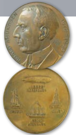
Herinneringsmedaille die twee jaar na de dood van Amundsen werd uitgegeven.