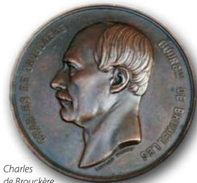
Charles de Brouckère

De eerste die na de oprichting van een nationaal Munthuis in 1832 aan bod komt is meteen ook de eerste Muntdirecteur. Niemand minder dan Charles de Brouckère , van het gelijknamige plein in Brussel, de wel erg