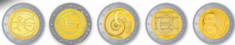
1 e plaats (41,48%) 2 e plaats (32,67%) 3 e plaats (11,15%) 4 e plaats (7,71%) 5 e plaats (7,01%)

Meer dan 40% van de kiezers koos voor de creatie van de Griekse beeldhouwer George Stamatopoulos , de ontwerper van de huidige Griekse euromunten. Het ontwerp symboliseert de euro als laatste stap in de lange geschiedenis van de handel, van de prehistorische ruilhandel naar de economische en monetaire unie.