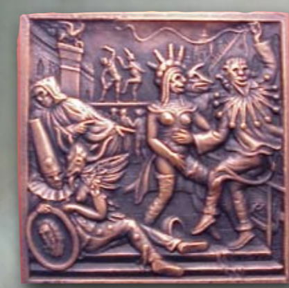
Nicolo Paganini (1985)