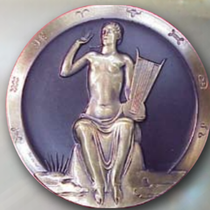
Pro Musica (1953)

Het stadsbestuur van Bastenaken liet in 1969 een medaille slaan ter gelegenheid van de 25 e verjaardag van de Slag van de Ardennen (Battle of the Bulge). Georges Andre Brunet realiseerde deze medaille die door het stadsbestuur werd uitgereikt aan de personaliteiten die de officiële plechtigheden bijwoonden.