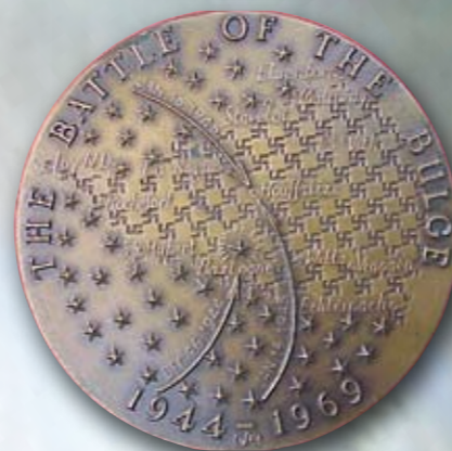
Slag Ardennen (1969)