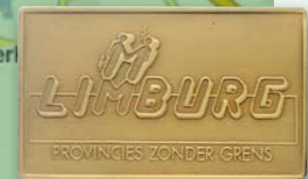
1989 Provinciale Sporttrofee