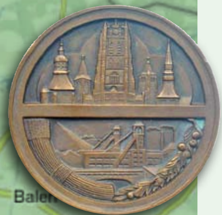
1952 - Officiële Erkentelijkheidsmedaille