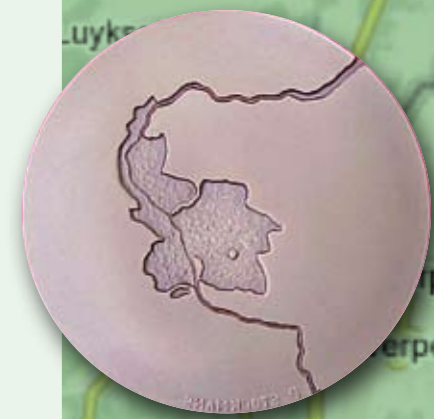
1989 Splitsing Limburg