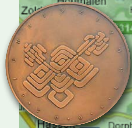
1992 - Inwijding nieuw Provinciehuis