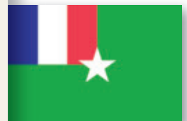
Vrijstaat Counani 1990