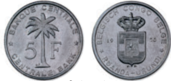
De nieuwe serie koloniale munten ontworpen door Joseph De Bruyn