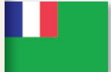
1e Republiek van Onafhankelijk Guyana (1886-1887)