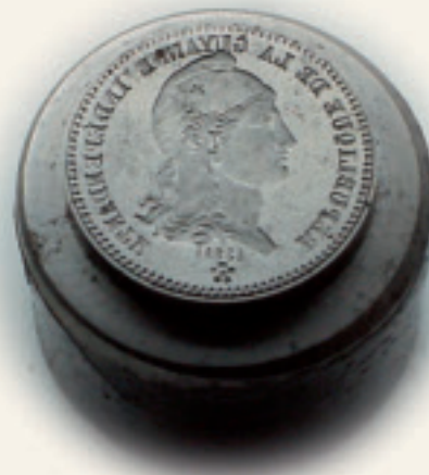
Stempel 20 centimes

Tijdens het zeer kortstondige bestaan van deze "republiek" werden bronzen stukken van 10 centimes en zilverstukken van 20 centimes en 5 francs geslagen. In de verzameling van de Munt bevindt zich een dienstmatrix voor een stuk van 20 centimes uit het jaar 1887. De stukken werden waarschijnlijk in het atelier van Charles Würden vervaardigd.