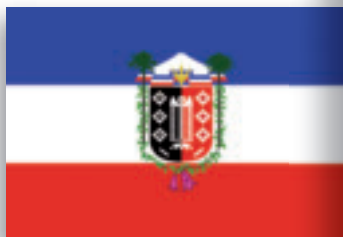
Onofficiële vlag van Araucanía