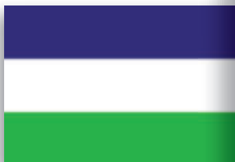
Vlag van het Koninkrijk Araucanía en Patagonië