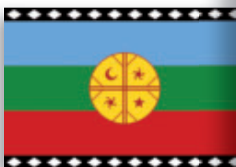
Vlag van de Mapuche-indianen