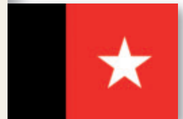
2e Republiek van Onafhankelijk Guyana 1887-1904