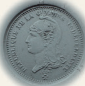
Afdruk 20 centimes

Vervolgens werd het gebied rond Counani geannexeerd door de Brazilianen en onder de naam van Araguay ingedeeld bij Para. In 1943 werd het een federaal territorium onder de naam van Amapa (sinds 1988 tot de status van volwaardige staat verheven).