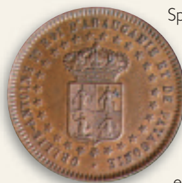
De bronzen muntstukken van 2 centavos en 1 peso