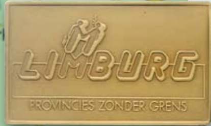
1989 Trophée Sportif Provincial