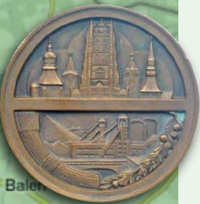
1952 - Médaille de reconnaissance officielle

Le panneau central reprend une composition symbolique constituée de deux visages et de feuilles. Les deux panneaux mobiles latéraux représentent la porte d'accès du Palais Provincial. La face extérieure est vierge, avec, en bas à droite, la représentation d'un lion couronné. Cette plaquette honorifique, tirée à 50 exemplaires, est une réalisation du responsable de fabrication de la Monnaie d'alors, Jean Van Den Spiegel.