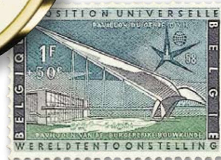
Monument du Génie Civil détruit aux années '70 pour faire place au futur Trade Mart Center.

A l'occasion de l'Expo 58, la Poste émet une série de timbres spéciaux dont un exemplaire représentait la Flèche du Génie Civil.