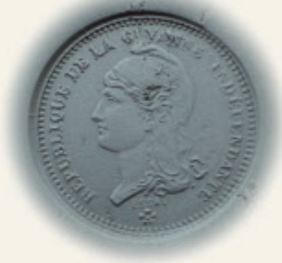
Épreuve 20 centimes

Ensuite, les Brésiliens annexèrent la région autour de Counani, qui fut partagée à Paris sous le nom d'Araguary. En 1943, celui-ci devint un territoire fédéral sous le nom d'Amapa (élevé au statut d'état à part entière depuis 1988).