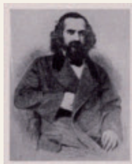
Orélie-Antoine 1 er

Les numéros de référence DM se réfèrent au catalogue "Les Monnaies Non Officielles" de Jean De Mey, publié entre 1965 et 67 comme supplément au "Bulletin de l'Alliance numismatique européenne".