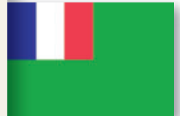
1 e République de la Guyane Indépendante (1886-1887)