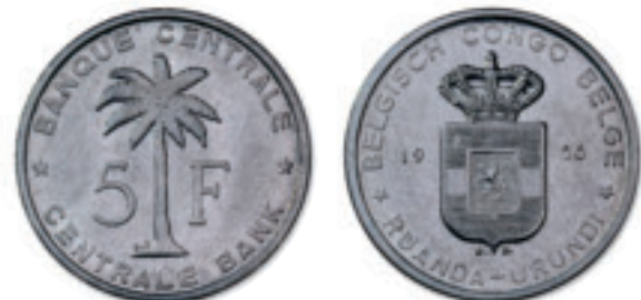
La nouvelle série de monnaies coloniales créées par Joseph De Bruyn