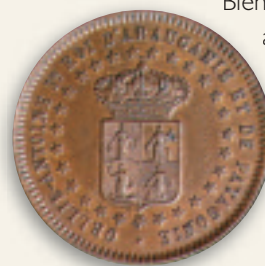
Les pièces en bronze de 2 centavos et de 1 peso