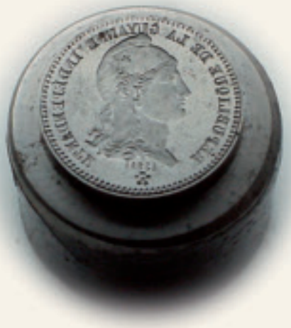
Poinçon 20 centimes

Pendant la courte vie de cette "république", on frappa des pièces de bronze de 10 centimes, ainsi que des pièces d'argent de 20 centimes et de 5 francs. Dans la collection de la Monnaie se trouve d'ailleurs une matrice prévue pour une pièce de 20 centimes de 1887. Les pièces furent probablement fabriquées dans l'atelier de Charles Würden.