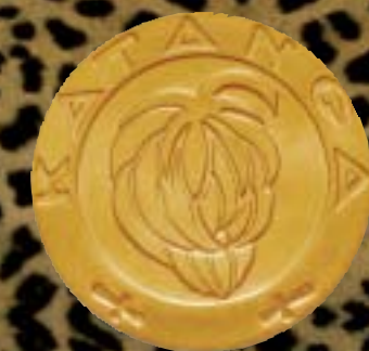
Gouden afslag van de Katangese munt van 5 frank