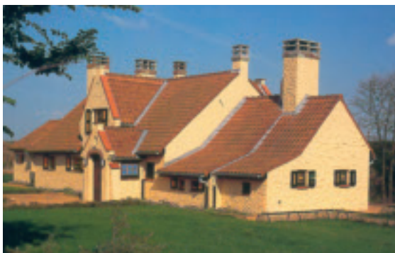
De villa van Prins Karel te Raversijde-Oostende waar hij tot aan zijn overlijden in 1983 verbleef