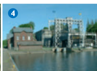
De vier scheepsliften van het Centrumkanaal