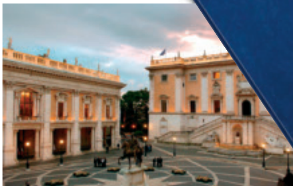
De bestrating van de Piazza del Campidoglio in Rome (ontworpen door Michelangelo), waar het Verdrag van Rome op 25 maart 1957 werd ondertekend, fungeerde als inspiratiebron voor de nieuwe 2 euro herdenkingsmunt.

Op 9 mei 1950 stelde de Franse Minister van Buitenlandse Zaken, Robert Schuman, het doel en de methoden voor, om de kolen- en staalindustrie van de West-Europese landen te bundelen. Ter herinnering hieraan koos Europa deze datum trouwens tot Europese feestdag.