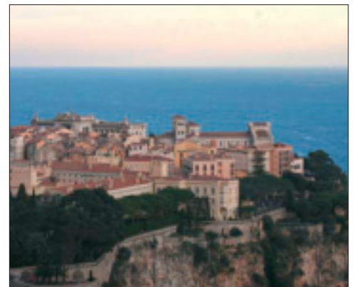
Prinselijk paleis van Monaco

Prins Rainier III overleed op 6 april 2005 en hij werd opgevolgd door zijn zoon Albert. Albert werd geboren te Monaco op 14 maart 1958 en hij werd officieel ingehuldigd op 19 november 2005 als Prins Albert II van Monaco. Eind 2006 tenslotte werden de nieuwe Monegaskische munten die verwijzen naar het nieuwe staatshoofd onthuld. De stukken van 1 en 2 euro dragen een naar links gekeerde beeldenaar van de nieuwe vorst terwijl op de stukken van 10, 20 en 50 cent een stijlvol monogram A prijkt. De kleinste pasmuntjes wijzigen niet.