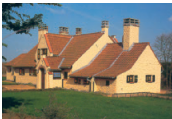
La villa du Prince Charles à Raversijde-Ostende où il séjournait jusqu'à sa mort en 1983.

Ce livre, préfacé par le Professeur Gustave Janssens, Archiviste du Palais Royal, et par Alex Deseyne, Conservateur du Mémorial Prince Charles à Raversijde-Ostende, constitue le catalogue complet des célèbres frappes d'essai et de la collection unique de médailles du Prince Charles. Voilà donc un ouvrage indispensable à la bibliothèque de tout collectionneur!