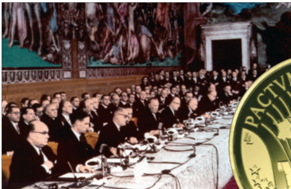
Signature du Traité de Rome le 25 mars 1957 • De gauche à droite: • Paul-Henri Spaak et Jean-Charles Snoy et d'Oppuers (Belgique) • Christian Pineau et Maurice Faure (France) • Konrad Adenauer et Walter Hallstein (RF d'Allemagne) • Antonio Segni et Gaetano Martino (Italie) • Joseph Bech (Luxembourg) • Joseph Luns et Johannes Linthorst Homan (Pays-Bas)

TIRAGE LIMITÉ À 2.500 EX. PRIX UNITAIRE 170 €