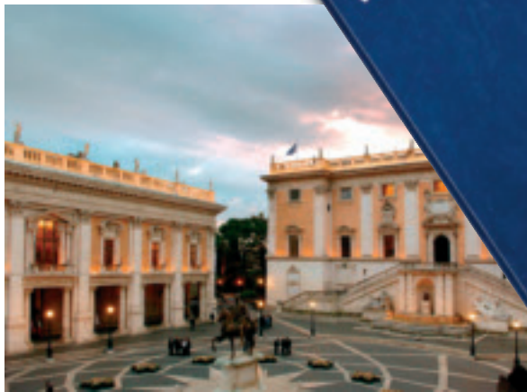
Le pavement de la Piazza del Campidoglio à Rome (créé par Michelangelo) où le Traité de Rome fût signé le 25 mars 1957, était la source d'inspiration pour la création de la nouvelle pièce commémorative de 2 euros.

Le 9 mai 1950, le ministre français des Affaires Étrangères Robert Schuman présente but et méthodes d'une union de l'industrie du charbon et de l'acier des pays d'Europe Occidentale. Pour mémoire, c'est d'ailleurs cette date du 9 mai qui deviendra le jour de la fête de l'Europe.