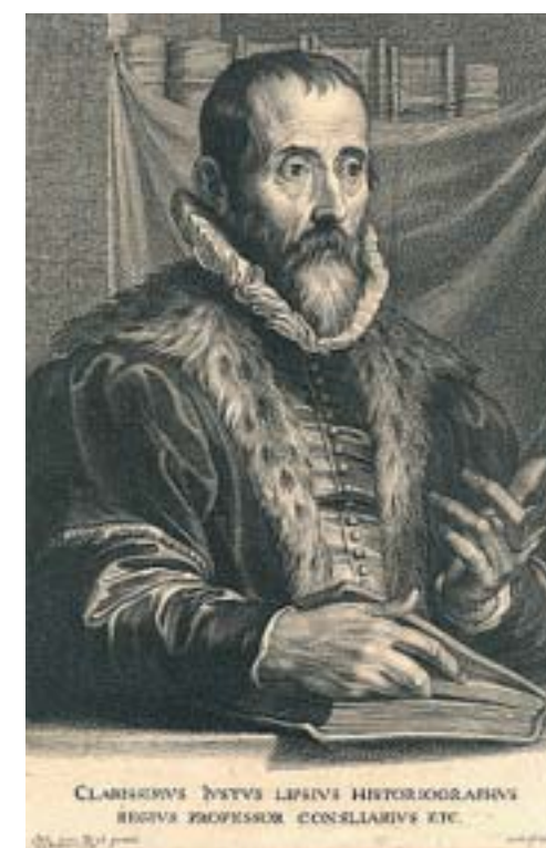
Portrait de Juste Lipse par Antoon Van Dijck ▶

Juste Lipse est né à Overijse le 18 octobre 1547 sous le nom de Jodocus Lips et décédait à Louvain le 25 mars 1606. Il était humaniste, philologue et historien. Lipsius enseignait à l'université "luthérienne" de Jena et "calviniste" de Leiden. Il choisit finalement de s'opposer à la violence de la Guerre de Quatre-vingts ans. C'est ainsi qu'il termina à nouveau comme enseignant à l'université de Louvain du côté "catholique". Sa principale oeuvre politique est "De Constantia" (1584).