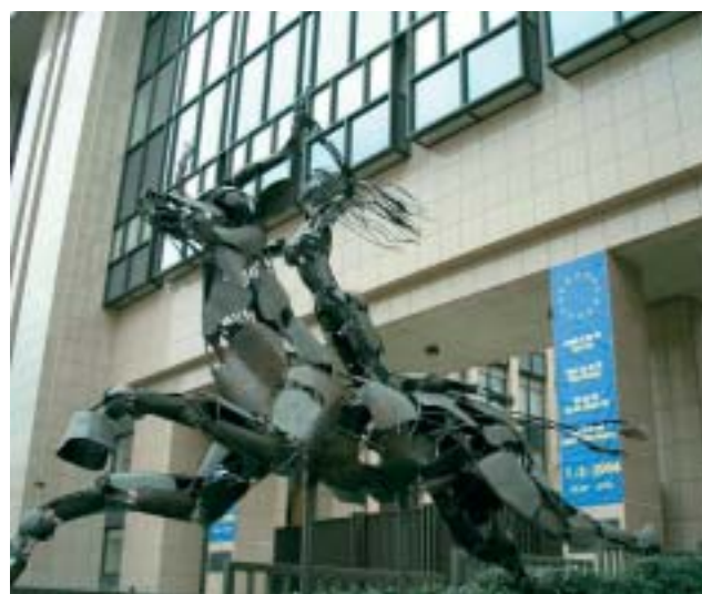
L'entrée de l'édifice Juste Lipse de l'Union Européenne à Bruxelles

Ce savant, avec ses connaissances multiples et variées, était une des personnalités les plus importantes de l'humanisme européen au 16 e siècle. En ce moment, il semble être un peu oublié mais dans sa ville natale, Overijse, aussi bien que dans la ville où il enseignait, Louvain,