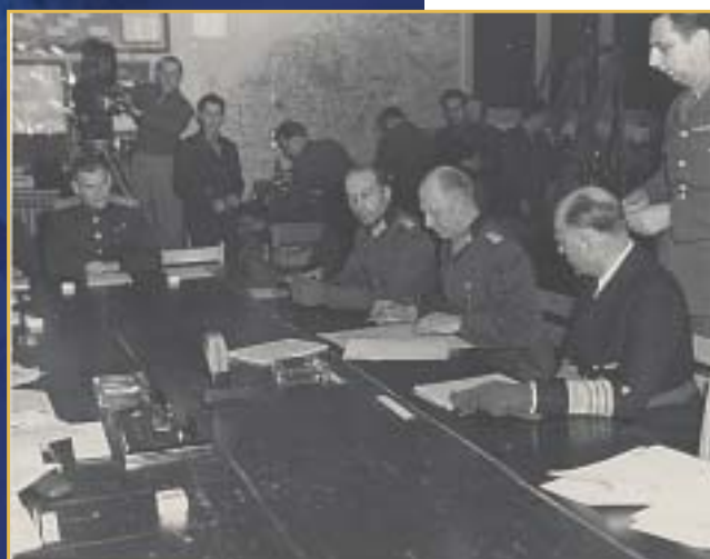
Signature de la capitulation allemande le 7 mai 1945 à Reims

Cet accord - certes alors encore limité - préfigurait le futur Traité de Rome en 1957, qui créait lui une véritable Communauté Européenne.