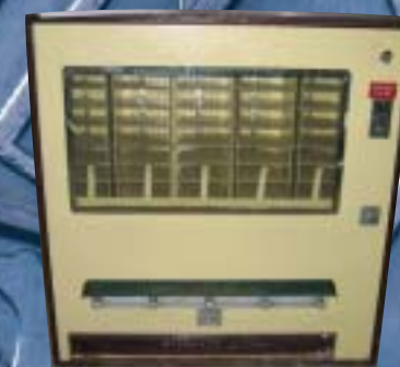
Distributeur de cigarettes à l'époque des années soixantes.