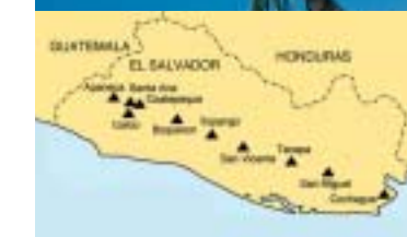
Le cratère de Santa Ana. Malgré sa petite superficie, le Salvador compte une dizaine de volcans (voir carte ci-dessous)