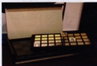
Le jeu d'échecs numismatique, véritable joyau monétaire produit par Andorre en 2007