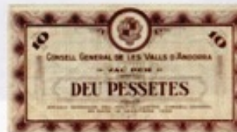
Billet de 10 pesetas, émis pour Andorre en 1936

Aujourd'hui, deux autres petits Etats européens utilisent l'euro comme Andorre, sans avoir le droit de frapper leurs propres pièces. Il s'agit du Kosovo et du Monténégro.