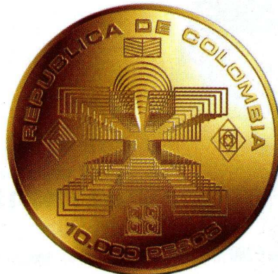
Spécimen pesos de Colombie