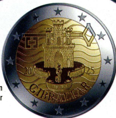
Spécimen Euro de Gibraltar