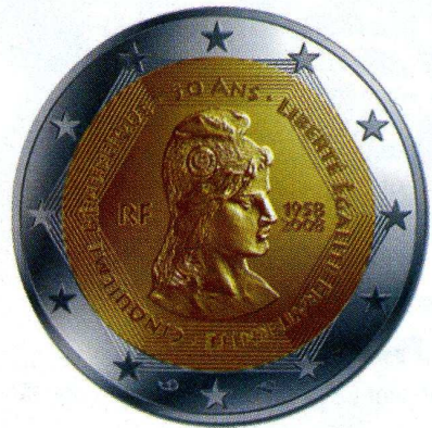
Spécimen 50 ans de V e République