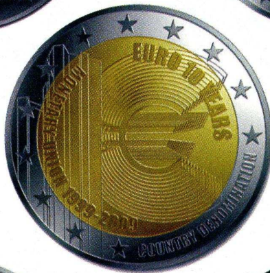
Spécimen 10 ans de l'Euro