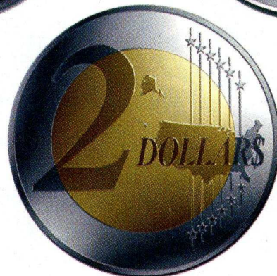
Spécimen de 2 dollars