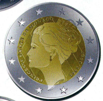
Spécimen 2 € Grace Kelly