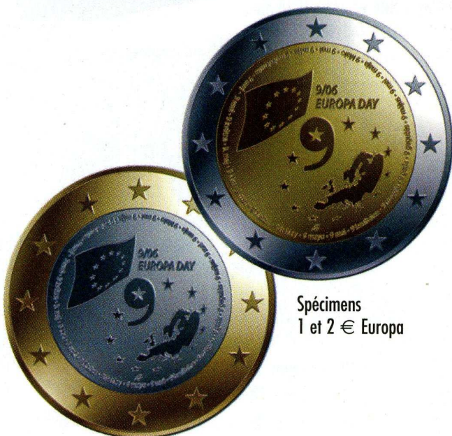
Spécimens 1 et 2 € Europa