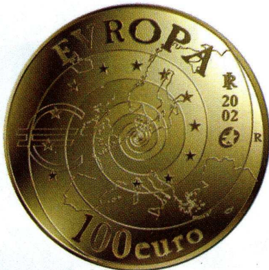
Spécimen 100 € Europa

Oui, je commence à m'intéresser à la création de billets, mais cela nécessite beaucoup plus de temps et de travail pour obtenir un résultat utilisable. ■