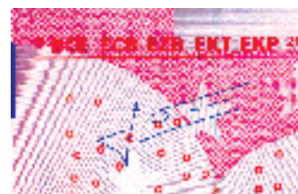
Jean Claude Trichet